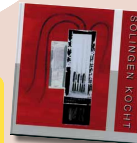
Hilft nicht nur kulinarisch: Solingen Kochbuch zugunsten von PHoS und dem Solinger Kinderschutzbund

Das Druckhaus Fischer hat zur Solingen Messe im Juli ein Kochbuch herausgegeben, in dem zahlreiche Solinger Restaurants ihre besten Rezepte veröffentlichten. Vom Gesamtpreis von € 10,- werden € 7,90 jeweils zur Hälfte an PHoS und an den Solinger Kinderschutzbund gespendet. In der PHoS-Geschäftsstelle können die Kochbücher erworben werden. PHoS wünscht viel Spaß beim Nachkochen und natürlich „Guten Appetit“!