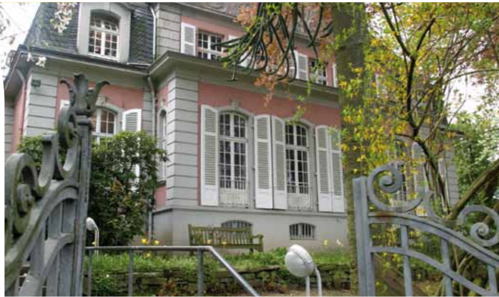
Absehbarer Abschied vom Theodor-Fliedner-Heim

In der Tagespresse und im nächsten LichtBlick werden Sie mehr lesen.