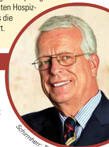
Schirmherr: Thomas Busch