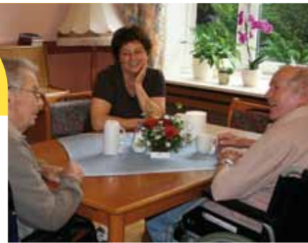
Kooperation von Pflege und Hospiz zum Wohle der Bewohner

Die Begleitung Sterbender in Einrichtungen der Altenhilfe unterscheidet sich von der ambulanten Betreuung im eigenen